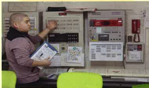
万が一に備えて、定期的に火災通報訓練を実施しています。