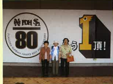
選手の一生懸命プレーする姿に感動しました。皆さんで楽しく応援しました。願いが届いたので、勝利しました！！