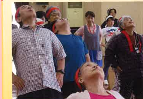
今年も赤白分かれての白熱した運動会！熱い声援にチーム一丸となって盛り上がりました。