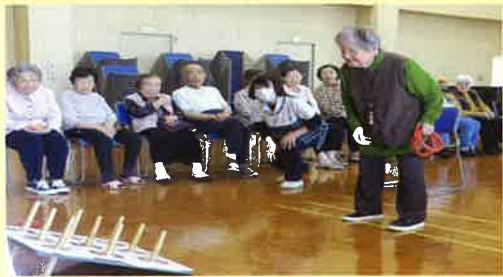
5月1日は長雲荘の開園記念日です。40周年の輪投げ大会となりました。