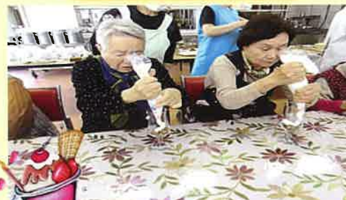
甘〜いパフェを作成中。出来上がりが楽しみ♪