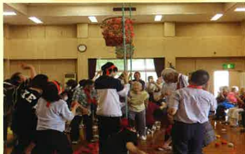
皆さんのいい笑顔が発見できました。