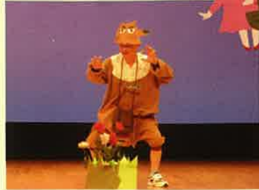
長雲荘の男性入居者でのお芝居です。赤ずきんちゃんを大熱演！ユーモア溢れるお芝居に、皆さんとたくさん笑いました。