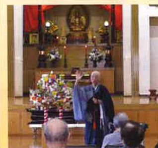
お釈迦様のお誕生日をお花と共にお祝いました。