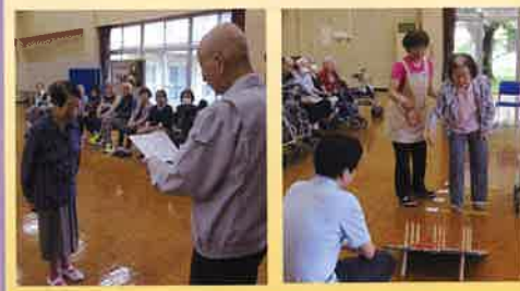
輪投げ大会、応援にも熱が入ります。