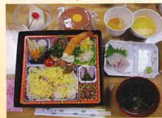
待ちに待った桜咲く春の訪れを、歌と踊りと舌鼓(したづつみ)で迎えました。