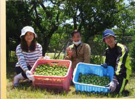
今年もお庭に梅がたわわに実りました。