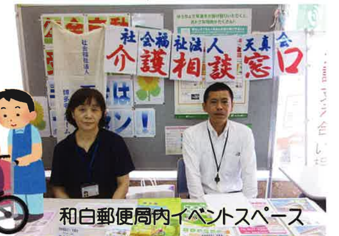
和白郵便局内イベントスペース