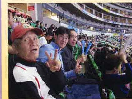
ヤフオクドームでホークスへ熱い声援