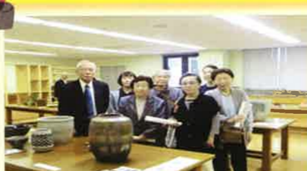
陶芸や絵画、生け花など、個性ある作品を見学してきました。