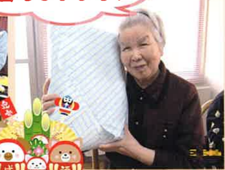
平成30年1月1日 元旦祭で今年の健康や幸せを祈り、新年会食ではお雑煮やおせちを楽しみながら、新年をお祝いしました。