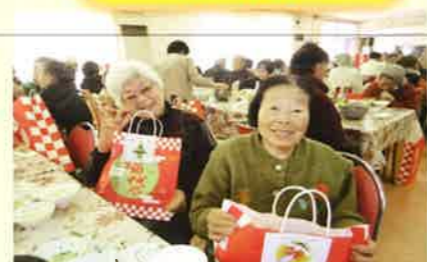
福引きをして新年の運試し！笑う門には福が来たる。今年はどんな福が舞い込んでくるでしょうか。楽しみです。良い年になりますように・・・