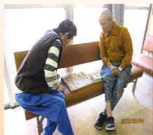
同じ趣味などを共に深め合い、笑顔と語りも増えていきます。