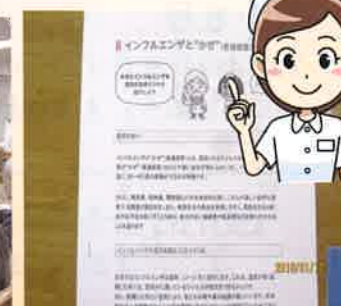
インフルエンザの予防について、看護師による健康教室が開かれました。正しい手洗い、換気、こまめな水分補給など、日々行える予防法をしっかりと学びました。