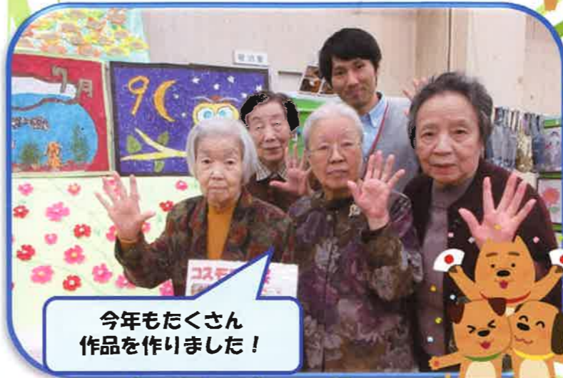
今年もたくさん作品を作りました！