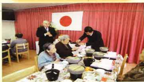
新しい一年の幕開けです。元旦祭・長寿祈願を終えた後、健康で新年を迎えられたことに感謝しつつ、新年の会食を行いました。お屠蘇やお雑煮、おせち料理を頂きました。