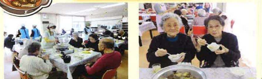
毎年恒例のすきやき会！3グループに分かれて行いました。皆様楽しみにしています。