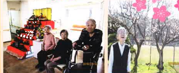
今日は雛祭、ちょうど梅の花も咲き始めました。桜餅と甘酒で一足早く春を感じながら自然に笑顔もこぼれます。