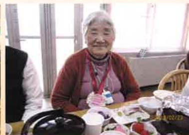
毎月全員でお誕生日をお祝いします。どなたも必ず主役になれる日♪