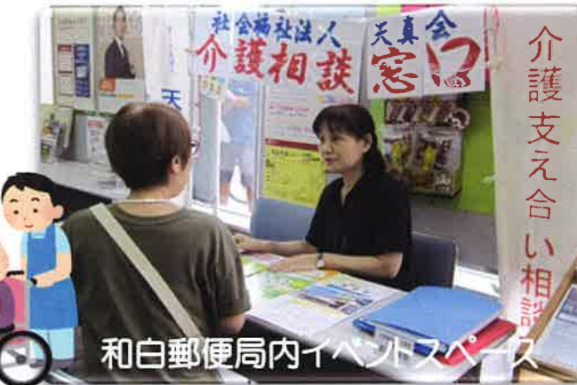
和白郵便局内イベントスペース

偶数月の中旬頃に9:30~15:00和白郵便局のイベントスペースにおいて「介護相談窓口」を開催しています。高齢者やご家族が住みなれた地域において安心して生活していただくための地域の身近な相談窓口として、今後も継続して活動していきます。電話でも受け付けています。どうぞお気軽にご相談ください。