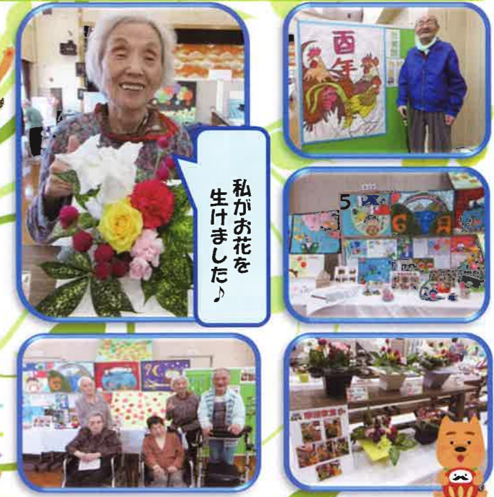
私がお花を生けました！