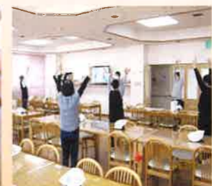
体を動かす教室が沢山。心も体もリフレッシュ。