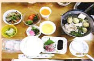
美味しいお鍋で心も体も温まりました。一年を振り返りながら声を合わせて歌いました♪