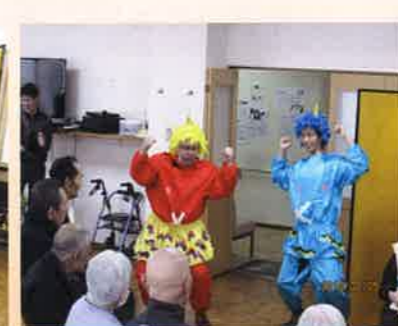
平成30年2月5日 年女のお二人は赤鬼さんと青鬼さんからプレゼントをもらいました。鬼は～外、福は～内、力強く豆まきをしました。