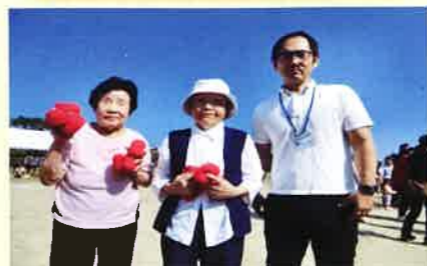
青空の下、いっぱい応援してきました！！