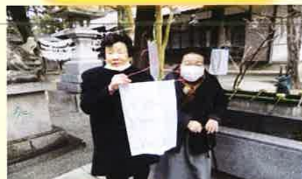
今年の新年の初詣は、志式神社で参拝をしました。「一年元気に過ごせますように」清々しい空気に包まれました。