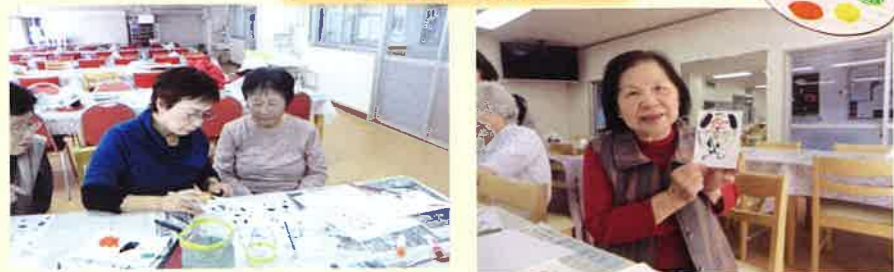
梅本先生にご指導頂き、画仙紙に筆ペン・絵の具を使用して年賀状を作成しました。干支の戌（いぬ）の絵を描きました。