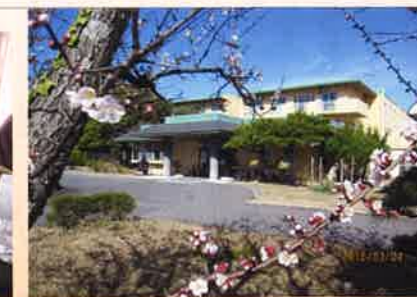
ホームの周囲に季節を告げる花々がほころび始めています。