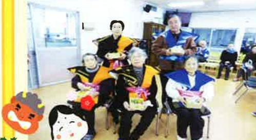
鬼を払い、たくさんの福を招き入れました。